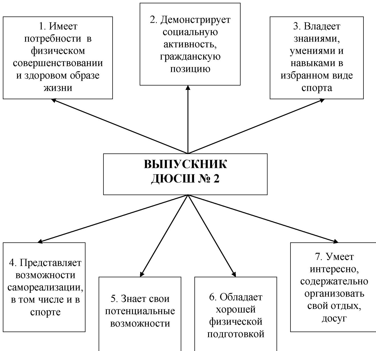
Рис. 1. Модель выпускника ДЮСШ № 2.