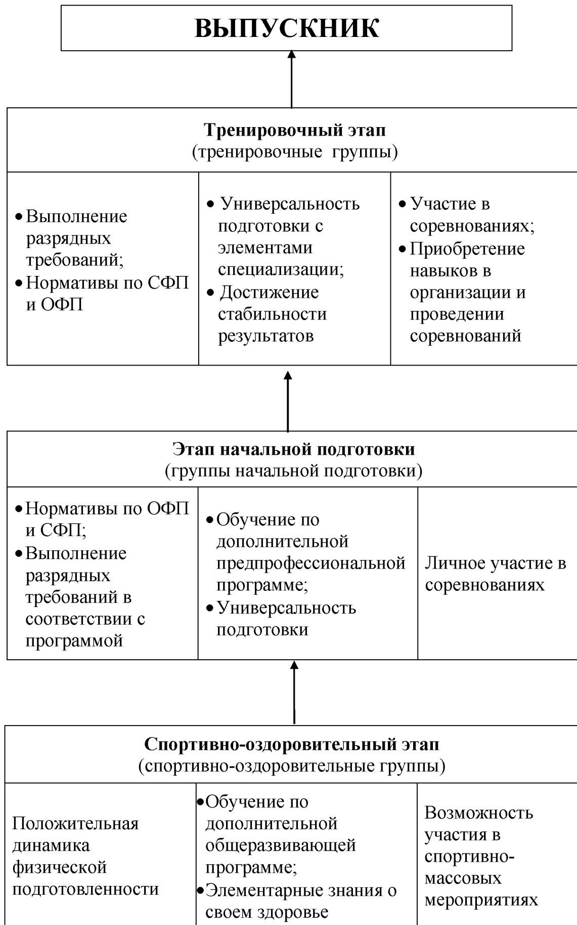
Рис. 2. Система организации образовательного процесса.